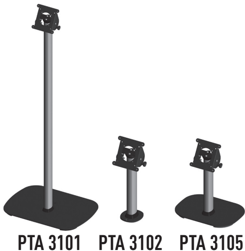
PTA 3101 PTA 3102 PTA 3105

Mounting instructions Montagevoorschrift Instructions de montage Montageanleitung Guía de montaje Istruzioni di montaggio Instruções de montagem Monteringsanvisning Instrukcja montażu Рекомендации по установке